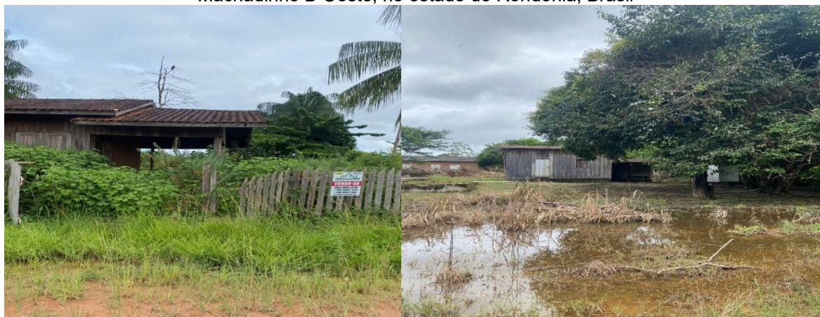
Figura 5 – Residências a venda e alagadas devido às fortes chuvas na Vila Tabajara no município de Machadinho D'Oeste, no estado de Rondônia, Brasil