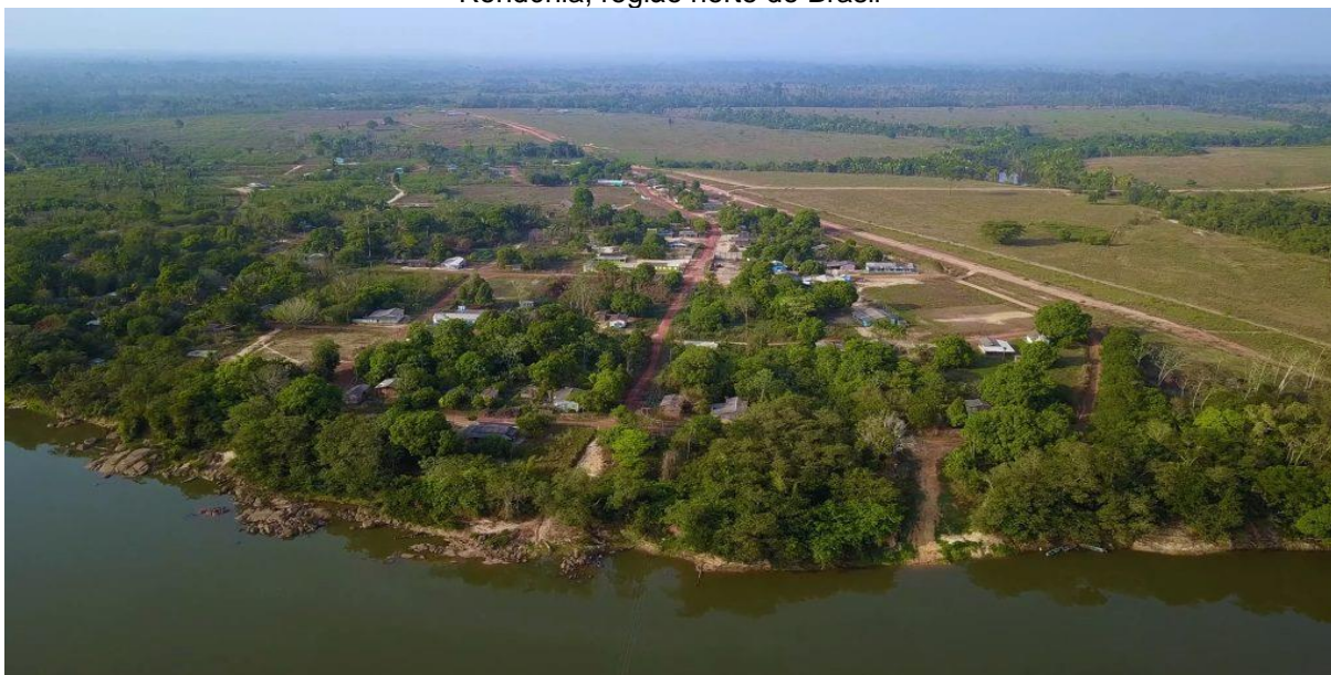
Figura 3 – Foto da vila Tabajara, situada na zona rural da cidade Machadinho D'Oeste, no estado de Rondônia, região norte do Brasil