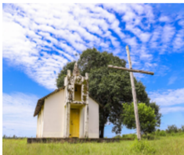
Figura 1 – Igreja Nossa Senhora do Perpetuo Socorro, situada na vila Tabajara, em Machadinho D'Oeste, no estado de Rondônia, Brasil.

É importante notar que o distrito de Tabajara é uma região maior, da qual a vila de Tabajara faz parte. Embora a vila esteja dentro dos limites do distrito, as duas não são a mesma coisa. O distrito inclui outras áreas e comunidades além da vila de Tabajara, que é apenas uma das localidades dentro do distrito.