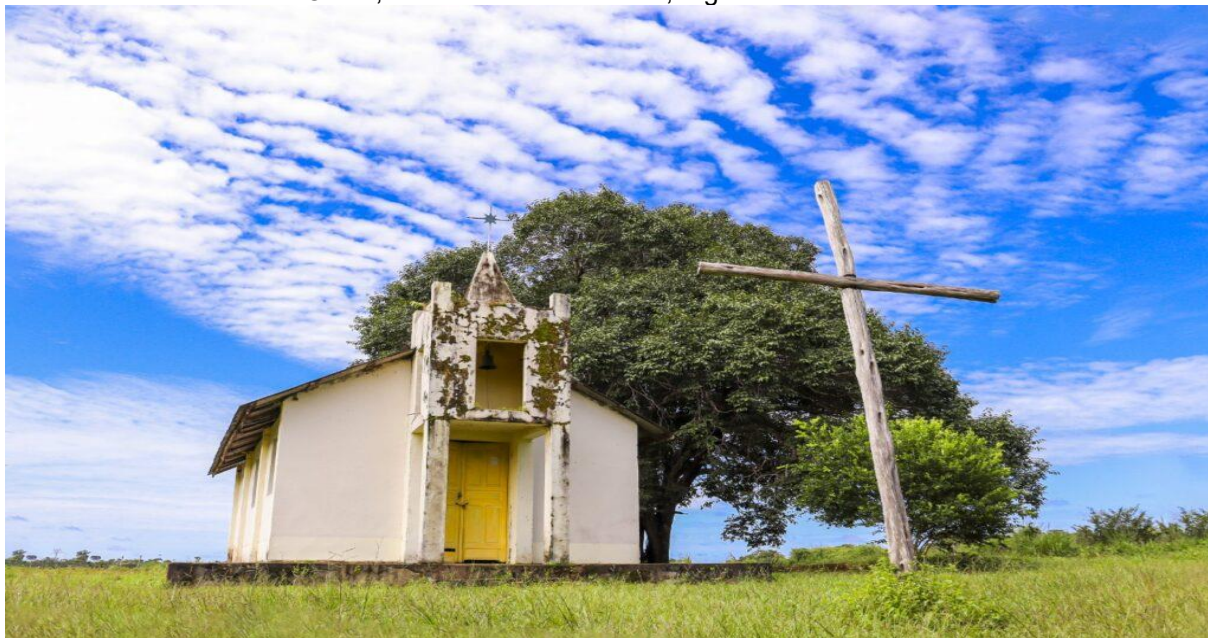
Figura 2 – Igreja Nossa Senhora do Perpetuo Socorro, situada na vila Tabajara, em Machadinho D'Oeste, no estado de Rondônia, região norte do Brasil