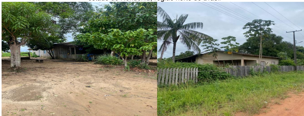
Figura 4 – Residências abandonadas na Vila Tabajara no município de Machadinho D'Oeste, no estado de Rondônia, região norte do Brasil

A possível construção da UHE Tabajara está diretamente ligada a aspectos que influenciaram a construção da Vila Tabajara, assim como o empreendimento em questão continua a influenciar o movimento da vila até os dias atuais. Atualmente, muitas casas encontram-se à venda ou abandonadas. Os moradores justificam que, ao longo dos anos, pessoas ouviram falar sobre a possível construção da usina e viram nisso uma oportunidade de ganhar dinheiro, acabando por comprar casas com o intuito de serem indenizadas caso a usina fosse realmente construída. No entanto, como a usina não foi construída até o presente momento, muitos desistiram de continuar residindo na vila e colocaram suas moradias à venda ou abandonaram o local. A seguir, nas Figuras 4 e 5, pode-se observar o registro de algumas casas da Vila Tabajara.