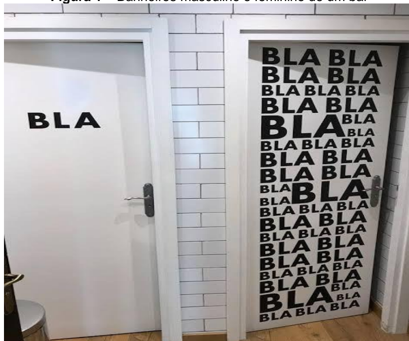
Figura 1 – Banheiros masculino e feminino de um bar